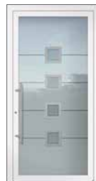
Hauteur: 2.240 mm