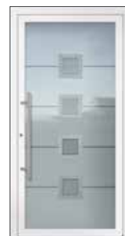
Hauteur: 2.000 mm

Les tailles de motifs (parties vitrées) restent toujours de même hauteur et largeur, et ne sont pas ajustées individuellement. Par conséquent, si la hauteur est différente, le bord de remplissage restant supérieur ou inférieur sera plus petit ou plus grand.