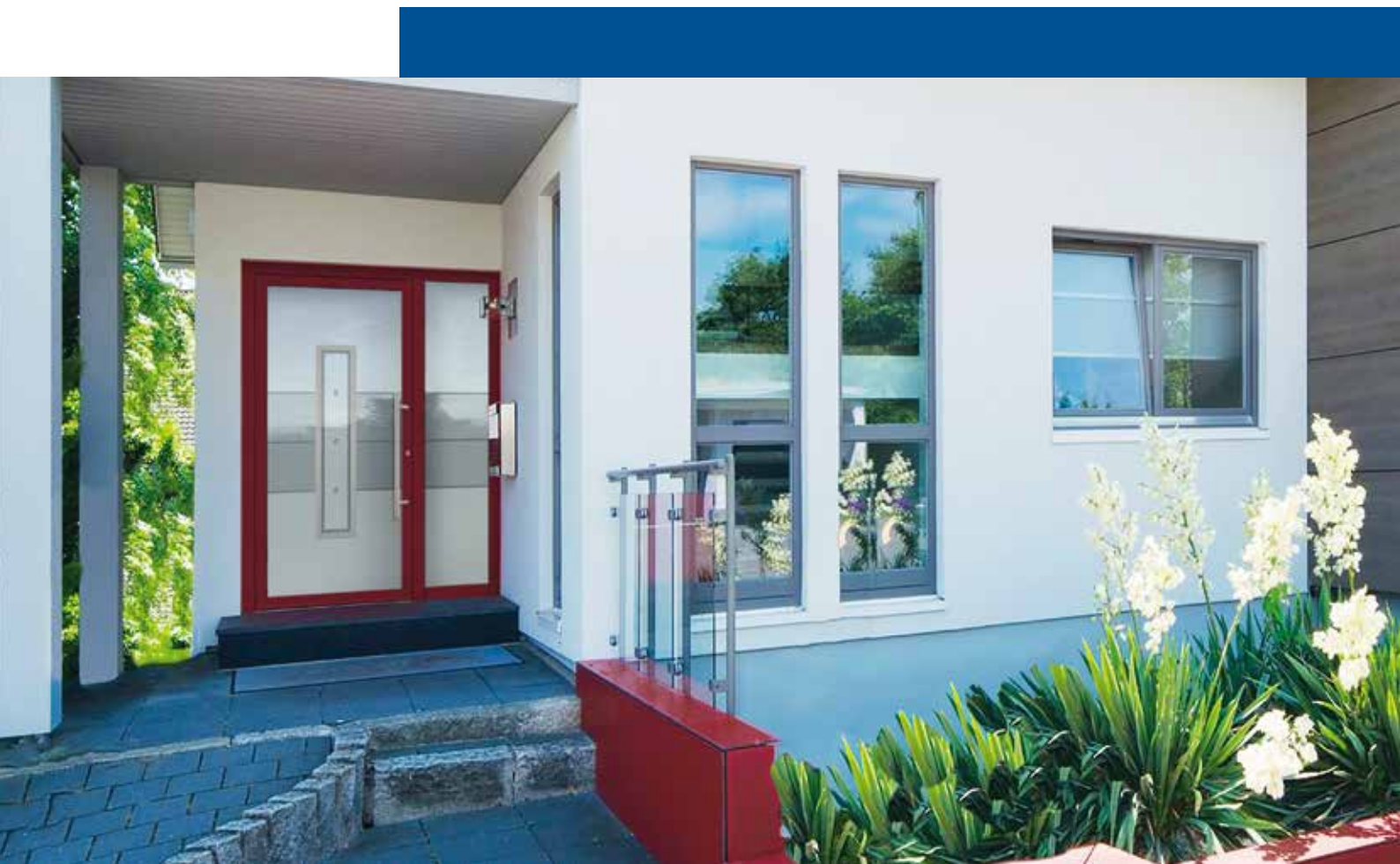
Modèle Vigro 1 Teinte: RAL 3005 Rouge Vin FS / Parties latérale 2) Sablé avec motif claires et mat sablé