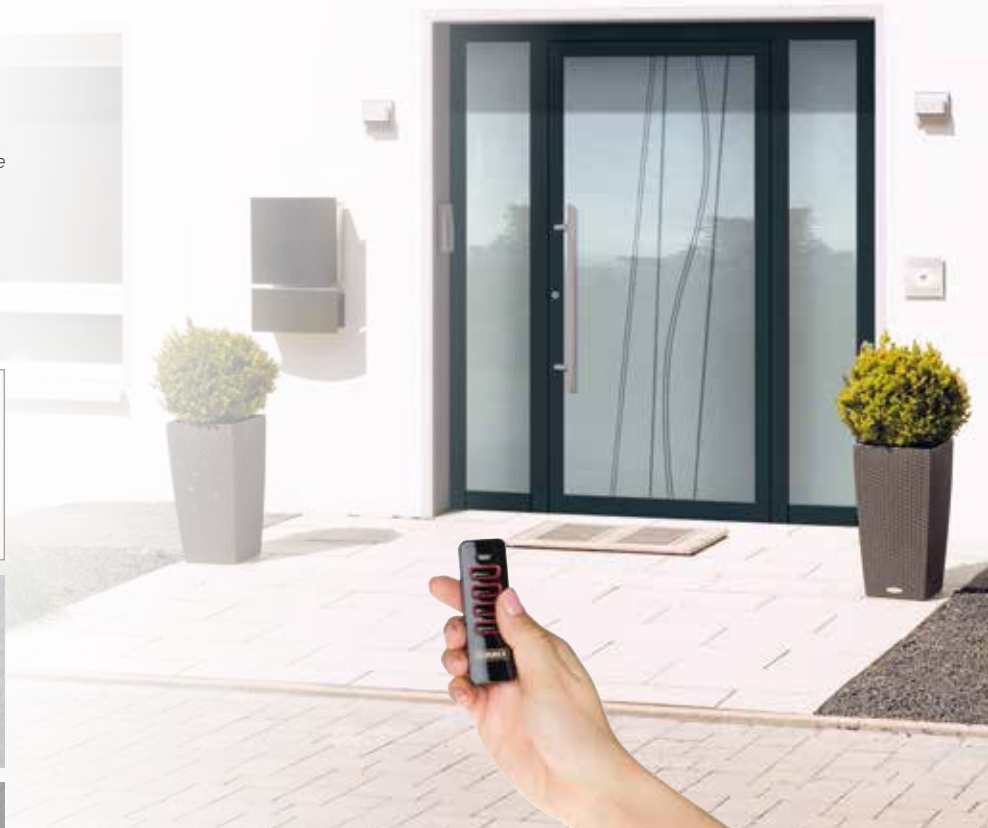
Ouverture avec télécommande