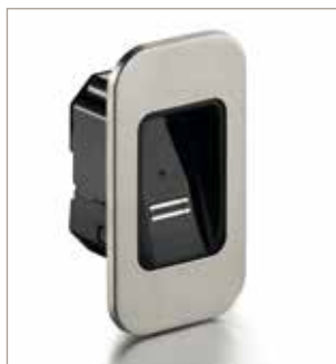
22052 ENTRAsys+ FD