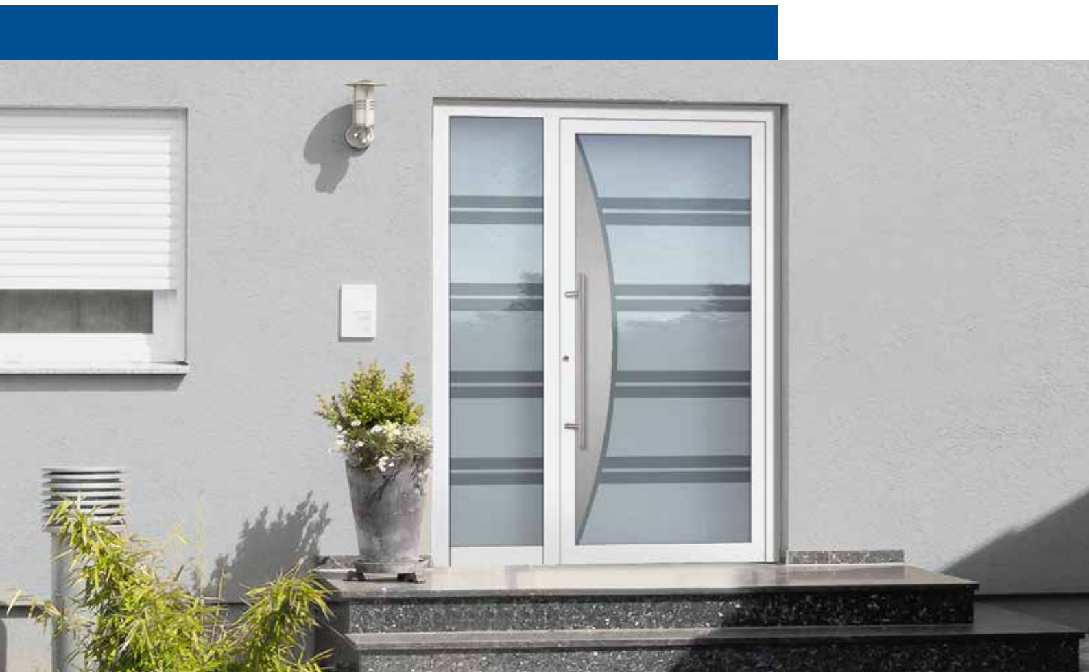
Modèle Vigro 34 Teinte RAL 9016 Blanc FS / Partie latérale 2) Sablé avec motif claires